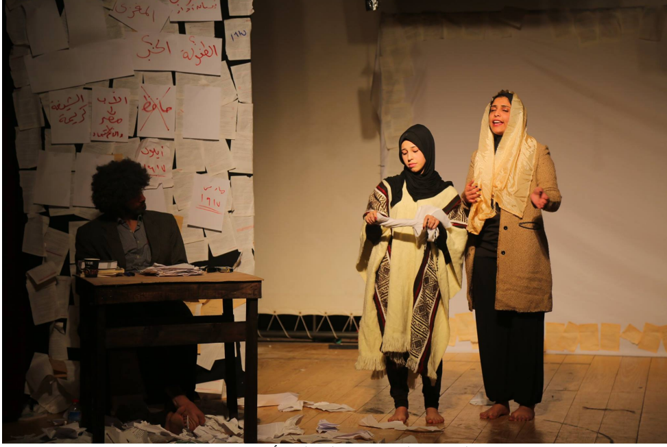
من العرض المسرحي/ الرحلة الأبهي.