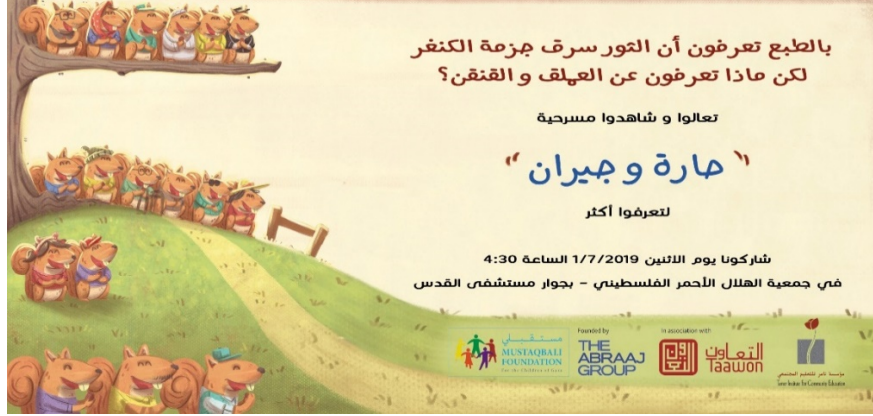
دعوة مسرحية " حارة وجبران "