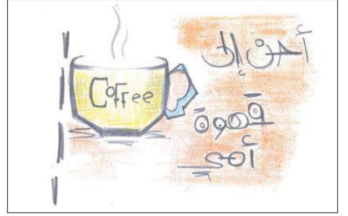
رسم: إسراء بدوان