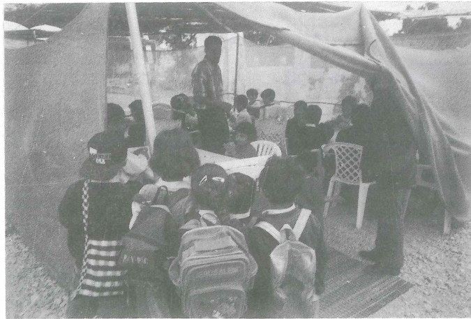
ورشة رسم حر ، من فعاليات مهرجان نوار نيسان

لأسباب مالية ، لم تتمكن المؤسسات القائمة على مهرجان نوار نيسان (مؤسسة تامر ، ومركز الفن الشعبي ، وسرية رام الله الأولى) من إقامة المهرجان . حيث صمم البرنامج بطريقة مميزة ولكنها مكلفة ، فرضت اللجنة العليا أن يؤثر الوضع المالي على نوعية الأنشطة وبالتالي عدم تحقيق الهدف منها ، لذلك تأجلت خطط مهرجان (نوار نيسان) ل يتم تطبيقها في العام ٢٠٠٠ ، على أن تكثف اللجنة العليا جهودها لتجنيد الدعم المالي للمشروع .