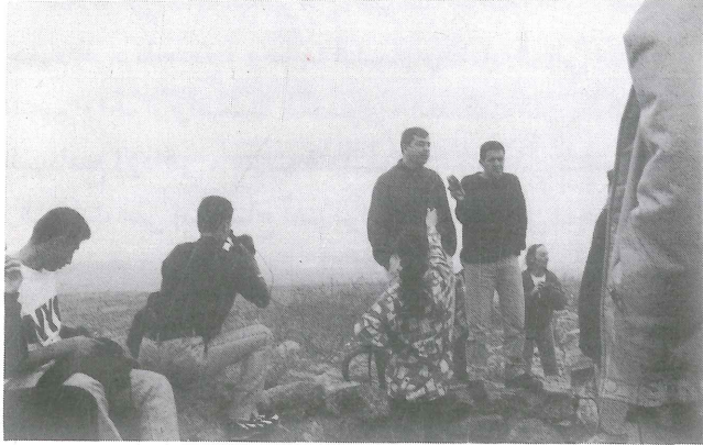
الشباب يجمعون الروايات الشفوية، يوثقون بالتصوير والرسم، ضمن رحلات القارة الصغيرة

مسمى أطلق على فلسطين، حيث لوحظ إختلاف وتعدد المناخات فيها. من مبدأ الاستكشاف، ومن الإيمان بجمال فلسطين وأهميتها التاريخية والحضارية والأثرية، انطلقت مجموعة من الشبان والشابات الذين أحبوا فلسطين ورغبوا بالتعرف عليها لتتحول من فكرة مجردة إلى واقع ملموس عن طريق الاستكشاف، ولتعزيز الهوية والانتماء إلى الأرض، فتعرفت في مسيرتها على المناطق، تاريخها، سكانها، نباتاتها، طيورها وحيواناتها فانتقلوا من قرية إلى أخرى، هذا يصور وذاك يكتب وثالث يرسم. ثم عززت استكشافها بالتوثيق.