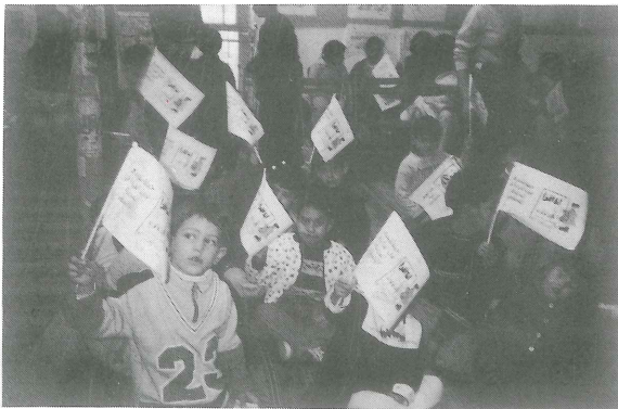
الأطفال المشاركون في فعاليات أسبوع القراءة الوطني، يعلنون: أنا أقرأ.

وقد زاد عدد المستفيدين من أنشطة الأسبوع عن ١٧,٥٠٠ طفل وطفلة، وشاب وفتاة، شملت محافظات الضفة الغربية، والقدس، وقطاع غزة، وأريحا، وداخل الخط الأخضر.