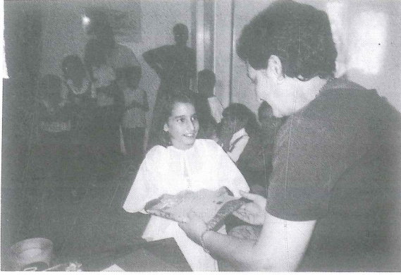
حفل اعلان نتائج توزيع الجوائز على الأطفال المشاركين / ات في مسابقة كتابي الأول