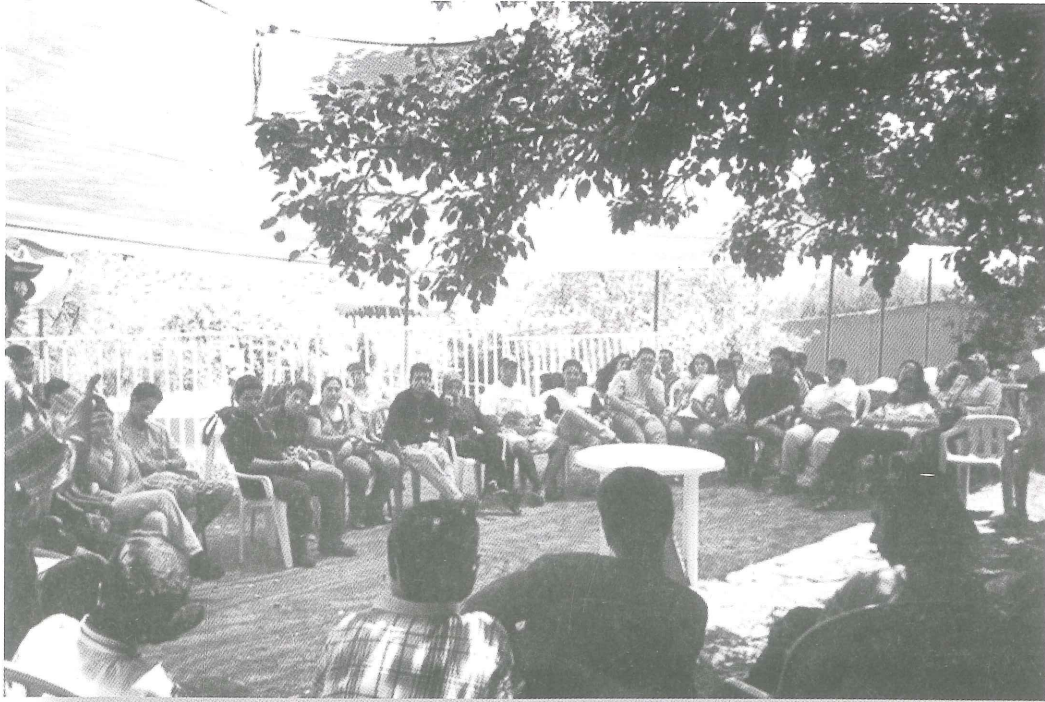
من جلسات التقييم لأيام صيفية

وهدف النشاط بفعالياته وورشه إلى دمج الشباب من فرق