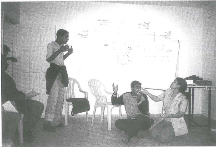
من ورشات الشباب في محافظة غزة

خلال سنوات عمل المؤسسة مع الشباب ومن خلال مواقع كثيرة تفاعل فيها الطرفان، أبدى الشباب رغبة في العمل على