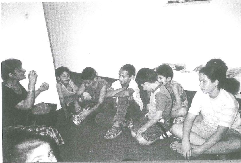
من ورشات رواية القصة في مركز موارد أدب الأطفال

منذ العام 92 ومؤسسة تامر تتواصل مع المدارس